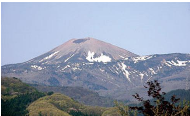
うさぎの形をした残雪

ひまわりが生んだ福島銘菓「福島の種まきうさぎクッキー」。お土産や贈り物にいかがでしょうか^^ ぜひお問い合わせ下さい！