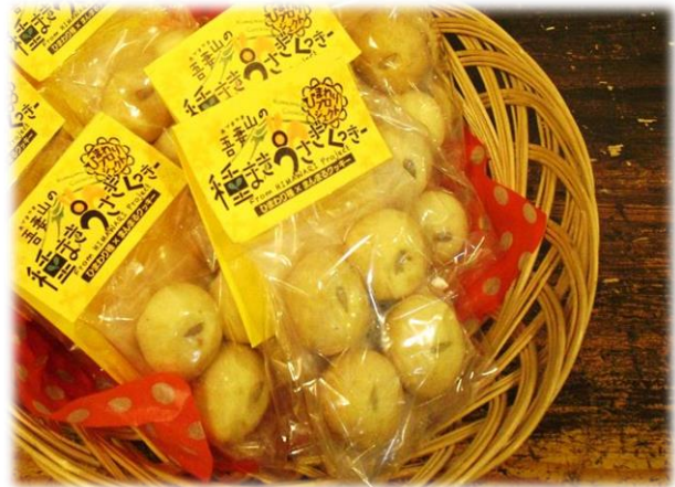
8ヶ入 400円。ひまわりの香りが口の中に広がります！

その名も「福島の種まきうさぎクッキー」。福島県と山形県の境には、吾妻山(あづまやま)がそびえ立っています。